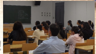
受講態度のよさも折り紙付き!!!

明けましておめでとうございます。本年もどうぞよろしくお願いいたします。 さて、キャリアサポートセンターでは一般学生はもちろんのこと、留学生や障害学生などのキャリア支援も行っています。今回はそんな留学生についてご紹介したいと思います。 本学にはアジアを中心に108カ国（地域）、約2700名の留学生が在籍しています。本学は、文部科学省の委託事業である留学生就職促進プログラムを受託し、他大学や官公庁、経済団体と連携して愛岐留学生就職支援コンソーシアムを形成しています。 私は英語が非常に苦手ですが、留学生の就職支援担当をさせていただいております。ただ、本学の留学生は日本語でコミュニケーションができるため、メールも電話も問題ありません。 (たまに日本語を話せない学生も来られて焦ることもあります、)。 ただ、就職活動においては、日本人学生と比較すると出だしが遅くなる、就活のマナーを知らないなど、日本独特の就職活動文化に慣れることに苦戦する学生がおります。 名古屋大学で高度な研究をしており、かつ多言語を使用できる留学生！ やると決めたら努力を惜しみません！是非選考で見かけた際には、注目いただけましたら幸いです。もしご興味ございましたらキャリアサポートセンターまでご連絡ください。どうぞよろしくお願いいたします。